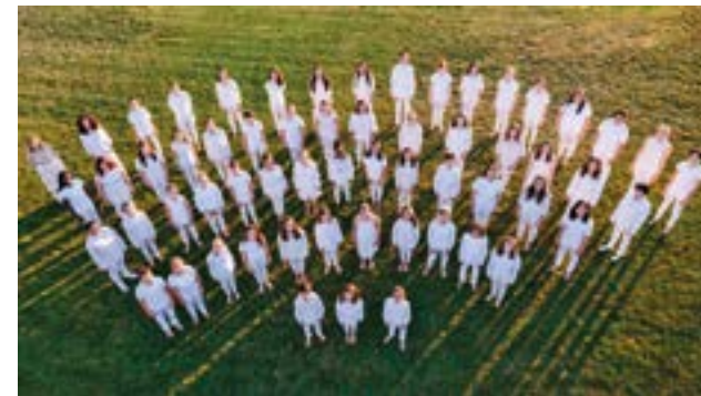
Coro juvenil del Coro Sinfónico de La Rioja